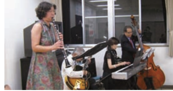
祝う会を盛り上げてくれたジャズ演奏

東村山市国際友好協会 1977年に設立。1978年1月26日にアメリカの中央に位置するミズーリ州インディペンデンス市と姉妹都市が提携され、現在は7つの委員会が構成されており、今年姉妹都市提携35周年を迎えました。両市の学生を相互派遣交流と5年毎に市民の交流を行っています。また、回田小学校はグレンデール小学校と姉妹校提携、第二中学校はパイオニアリッジ中学校と学校間の交流を行い、両市の友好の輪が広がっています。