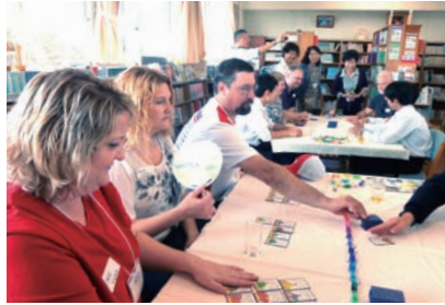
坊主めぐりに言葉はいらない（二中）