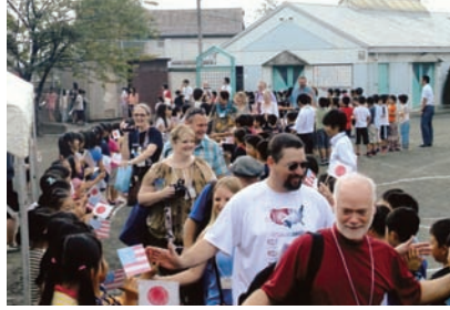
回田小のかわいい歓迎