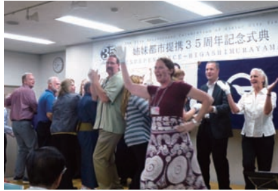
イ市訪問団によるパフォーマンス