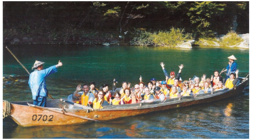
晴れてsmile！（鬼怒川ライン下り）