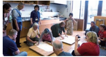
うどん作り（ふるさと歴史館）