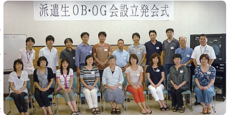
派遣生OB・OG会設立発会式

第1回目のOB・OG会が8月25日に開催され、20代30代の方々を中心に20名が参加しました。インディペンデンス市での思い出話などで盛り上がりでしたが、皆共通するのは、イ市へ行った経験が現在の生き方に大きく影響している事。イ市派遣OB・OGの皆さんのこれからの活躍に期待しています。