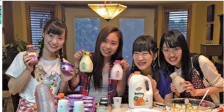
ホスト宅でワイワイ朝会!

東村山市の引率者と学生10名が8月5日～20日まで姉妹都市の米国ミズーリ州インディペンデンス市の家庭にホームステイしました。