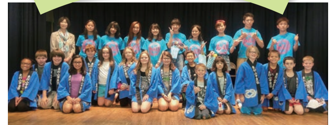
グレンデール小学校にて