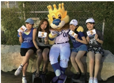
今年もガンバレ ロイヤルズ!