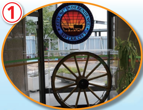
交流10・20周年のイ市からの寄贈品