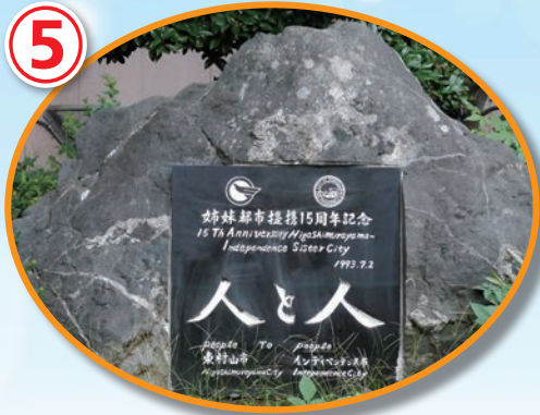
交流15周年の記念碑

姉妹都市イ市と市民交流を進めている団体が「東村山市国際友好協会」です。「派遣」「学生受入」「英会話」「会員拡充」「会員交流」「広報」「日本庭園協力」の7委員会にて、多くの会員が協力し合って活発に活動しています。