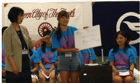
体験をボードで説明