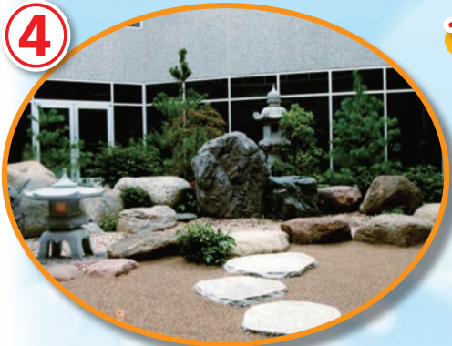
当協会が作った日本庭園