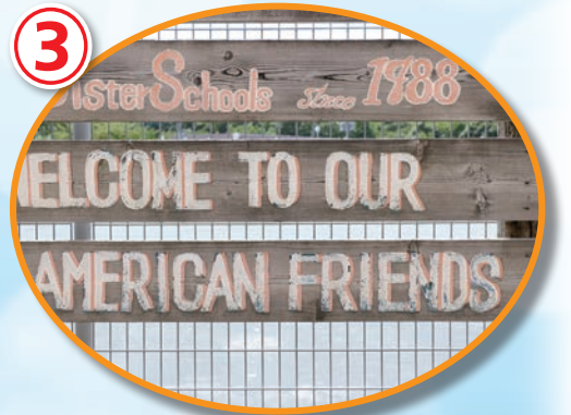
姉妹校の市内小学校