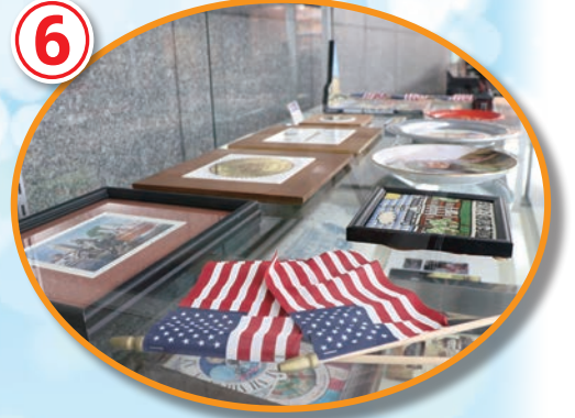
イ市からの寄贈品を展示

東村山市⇄インディペンデンス市 姉妹都市交流38年の足跡を探してみましょう ※ヒントを参考に、答えは欄外に