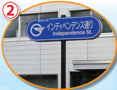
3年前市内の通りに命名