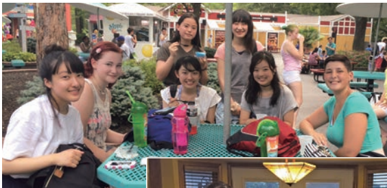
Worlds Of Fun (遊園地)