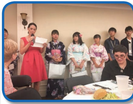
英語でスピーチ（市長バンケット）