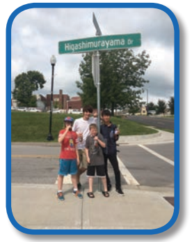
イ市の東村山通り

8月5日(土)～20日(日)までインディペンデンス市を訪問し、ホームステイして貴重な体験をしてきました。学生たちの驚きと感動をお伝えします。