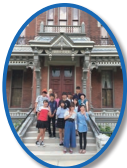
Vaile家 邸宅にて 全員集合!!