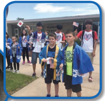
グレンデール小学校

イ市の方々には私たちにとても気を遣い、何から何まで私たちが困ることのないように全力でサポートして下さいました。また、あるメンバーがホストファミリーの事情で家に帰れなくなった時、すぐに自分の家を提供してくれるイ市の人の優し